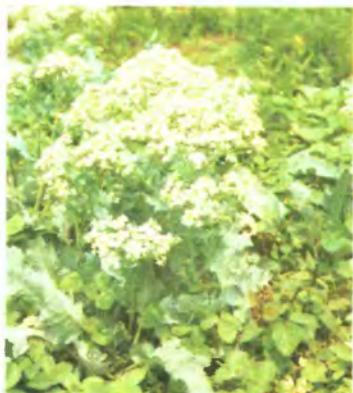
348. Катран татарський.